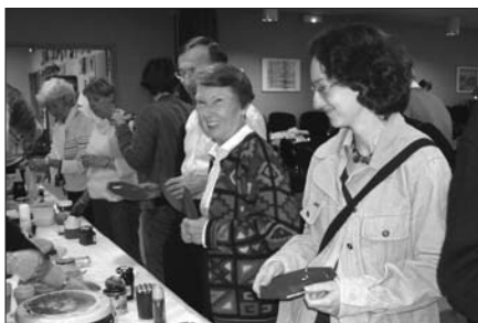
Et pour vous, ce sera quoi ?

4 crêpières installées en batterie, derrière lesquelles officiaient des marmitons bénévoles, attendaient les desideratas de chacun pour réchauffer et compléter les crêpes. Jambon, fromage, Nutella, caramel au beurre salé... le choix était vaste. Bien sûr on a joué au bridge, mais l'odeur alléchante en a distrait plus d'un pressé de retourner se servir.