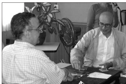
Sourire aux lèvres dès le début du tournoi