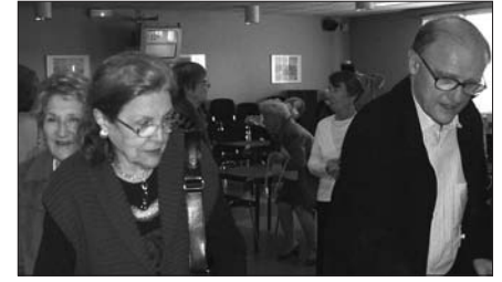
Choix difficile d'un lot quelque soit son classement

promesses quant au suspens. Le vainqueur, l'équipe Maguin est revenue de la 4 ème place. Les équipes Veisse et Cauchard, 2 ème et 3 ème du classement, ont toutes les deux fait un bon en avant de 4 et 5 places. Seule rescapée du classement au bout de 2 séances,