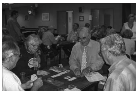
Deuxième tournoi animé