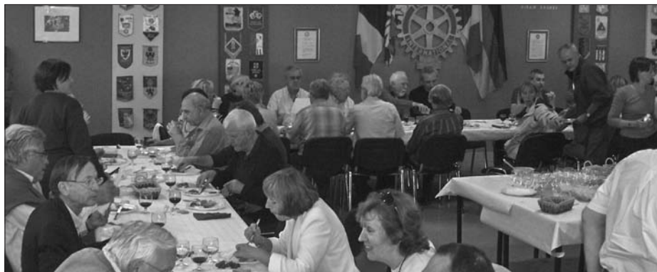
Après l'effort, la dégustation autour d'un agréable buffet

Le sérieux dominait les échanges lors de la première séance. Pour autant, l'ambiance aux tables était détendue et amicale. Puis est arrivé le grand moment : les premières bouteilles ont été débouchées et la dégustation a commencé accom-